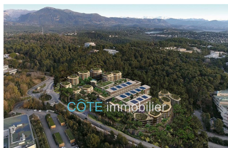
Programme neuf - Convention milancip - MLS Côte d'Azur