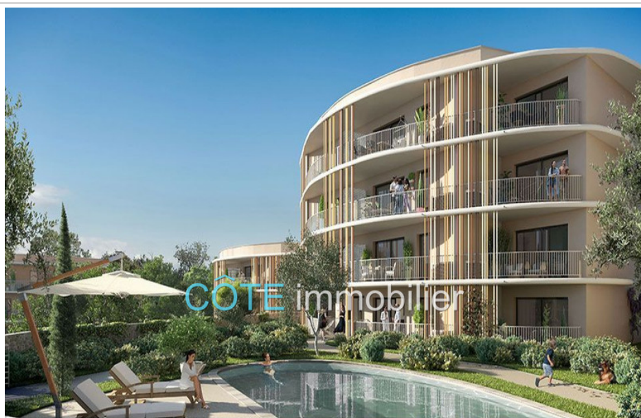
Programme neuf - Convention milancip - MLS Côte d'Azur