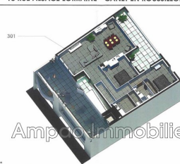
Plan de pré-commercialisation

RESIDENCE 13 RUE ALSACE LORRAINE - CANET EN ROUSSILLON