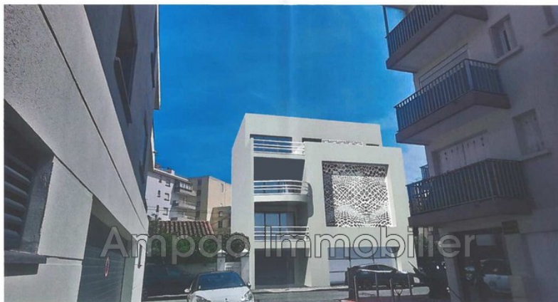
Plan de pré-commercialisation

13 RUE ALSACE LORRAINE - CANET EN ROUSSILLON