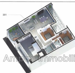
Plan de pré-commercialisation

RESIDENCE 13 RUE ALSACE LORRAINE - CANET EN ROUSSILLON